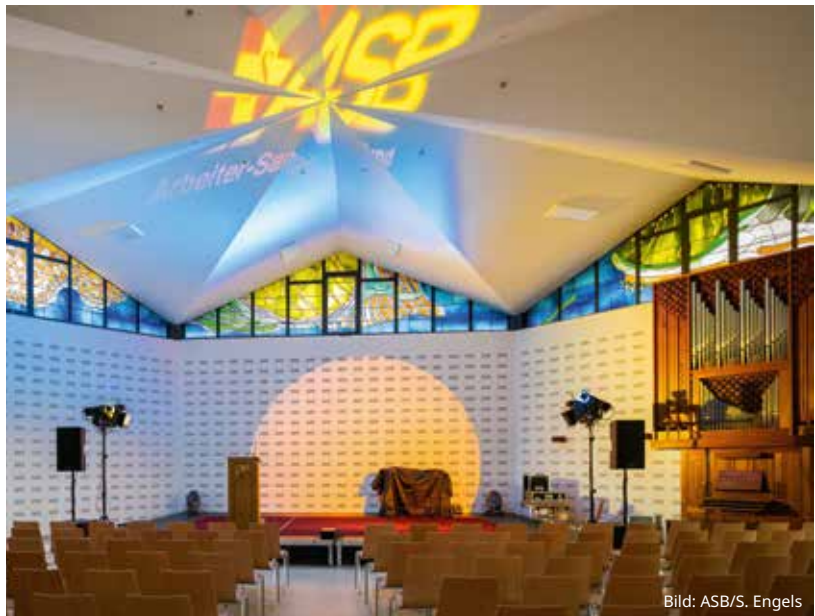
Das „Heptagon“ dient als kultureller Veranstaltungsraum und Begegnungsstätte.